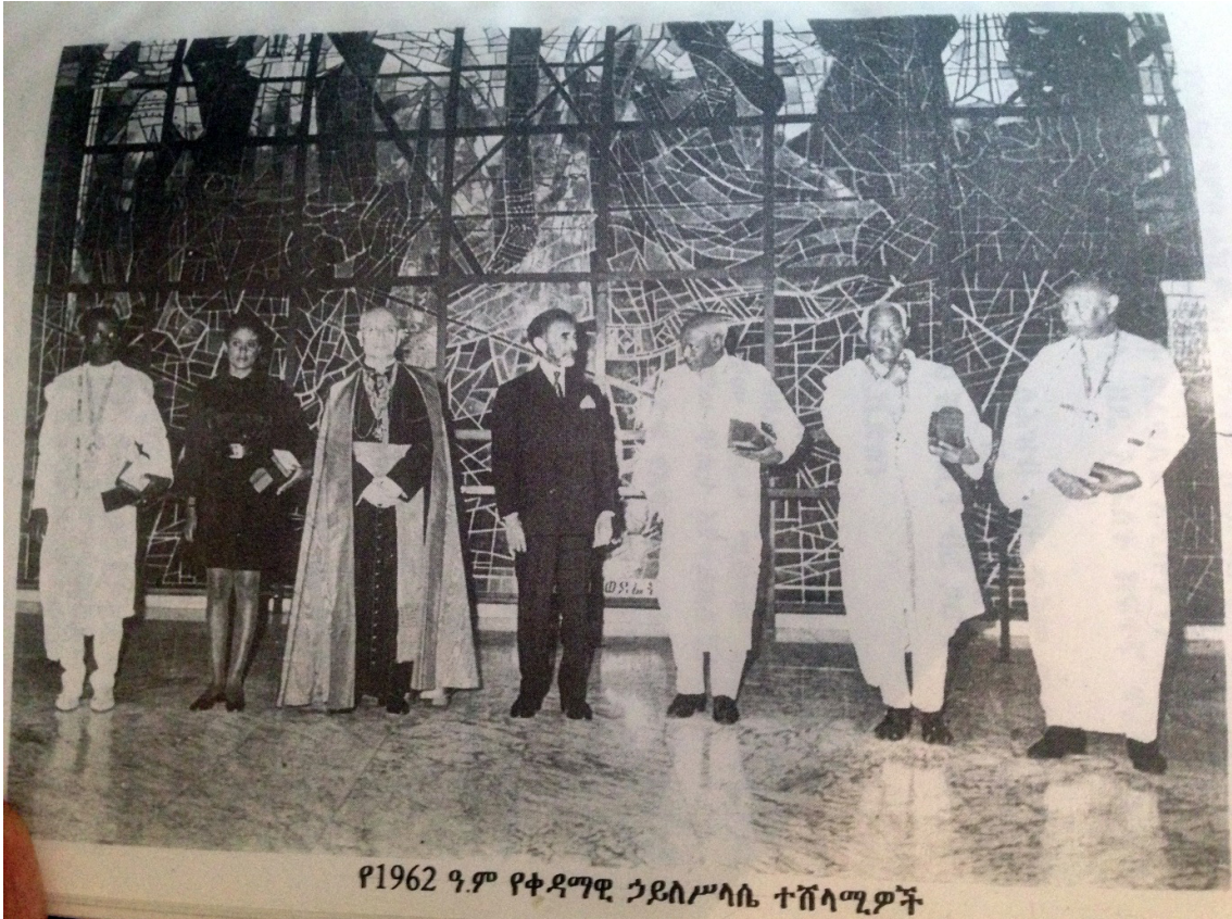
የ1962 ዓ.ም የቀዳማዊ ኃይለሥላሴ ተሸላሚዎች